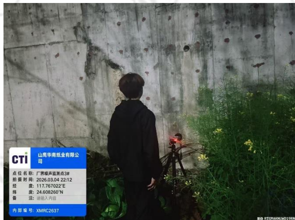
厂界噪声监测点 3# (夜间)