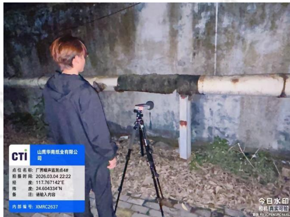
厂界噪声监测点 4# (夜间)