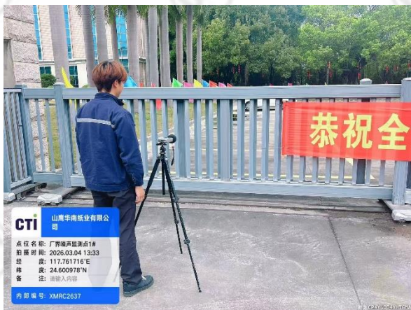
厂界噪声监测点 1# (昼间)