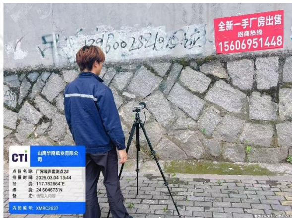
厂界噪声监测点 2# (昼间)