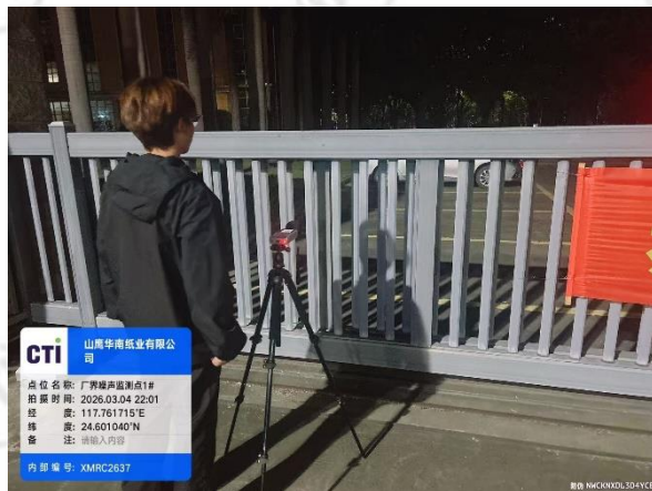
厂界噪声监测点 1# (夜间)