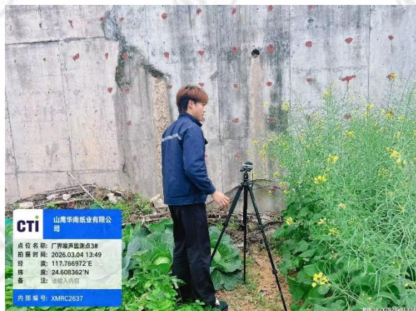
厂界噪声监测点 3# (昼间)