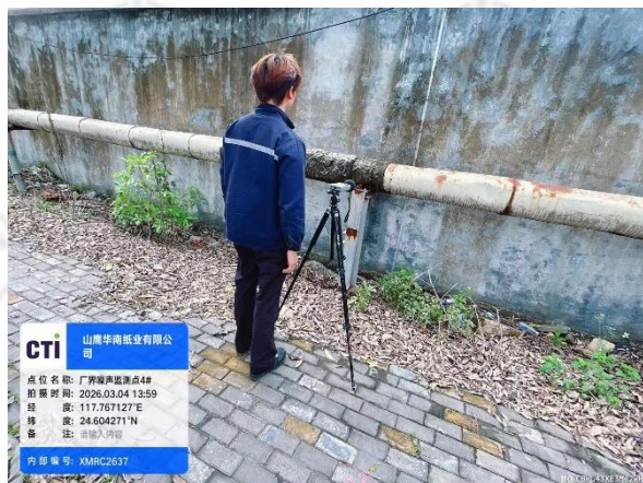
厂界噪声监测点 4# (昼间)